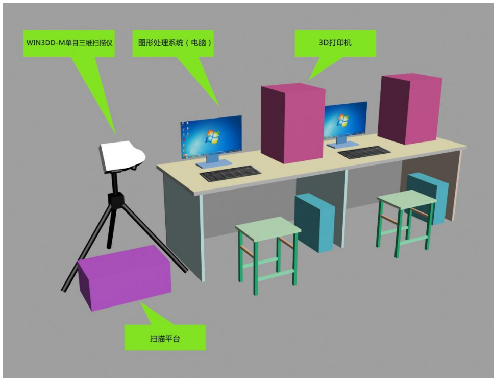
图 3 技术平台示意图