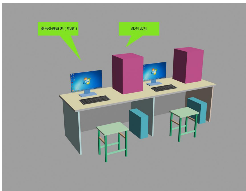
图 3 技术平台示意图